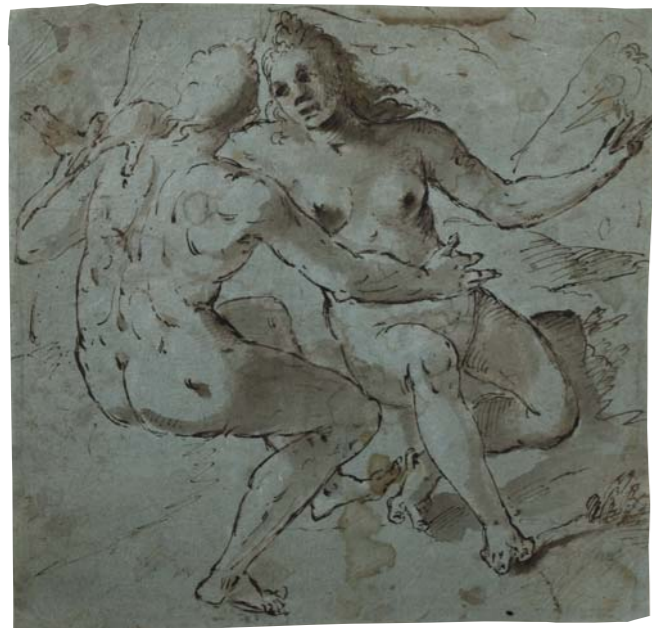
Unbekannter italienischer Zeichner Liebespaar, 16. Jahrhundert

◆ 100 Jahre Kurpfälzisches Museum im Palais Morass auf der Heidelberger Hauptstraße sind Anlass für eine besondere Ausstellung – die Präsentation ausgewählter Werke der Zeichenkunst aus eigenem Bestand in einem weit gespannten Bogen über fünf Jahrhunderte. Die empfindlichen Kostbarkeiten auf Papier sind dem breiten Publikum weniger bekannt als Kennern und Fachspezialisten, da sie oft nur für einige Wochen in Sonderausstellungen gezeigt werden können. Nun besteht für 2 1/2 Monate die Gelegenheit, sich an ausgewählten Werken des 16.-20. Jahrhunderts zu begeistern.