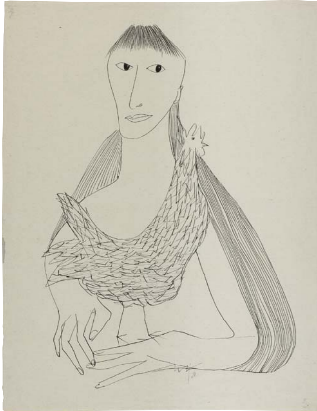
Willibald Kramm Frau mit Huhn, 1953

Da von der Handzeichnung eine besondere Faszination ausgeht, weil sie dem Betrachter gleichsam einen Blick über die Schulter des Künstlers ermöglicht, werden ergänzend auch zahlreiche im graphischen Bestand vorhandene Skizzenbücher ausgestellt, die einen unmittelbaren Einblick in die jeweilige künstlerische Arbeitsweise ermöglichen. Als ehemals kleinformatische Ideenvorräte und mobile ständige Reisebegleiter geben sie dem heutigen Betrachter oft überraschende Einblicke in die Künstlerpersönlichkeit.