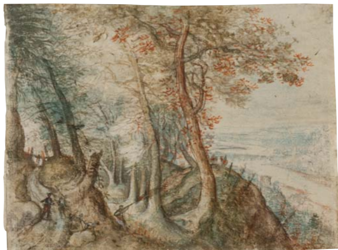
Pieter Stevens Berglandschaft mit Blick in die Ebene und Motiven des Heidelberger Schlosses und der Brücke, um 1586

Es werden Zeichnungen, Aquarelle, Pastelle und Gouachen in einer faszinierenden Vielfalt und künstlerischen Ausdrucksfähigkeit gezeigt. Der Bogen spannt sich von frühen italienischen Zeichnungen des 16. Jahrhunderts, zweck- und auftragsgebundenen Arbeiten des 17./18. Jahrhunderts über romantische Naturaufnahmen bis zu sehr privaten zeichnerischen Selbstreflexionen von Künstlern des 20. Jahrhunderts.