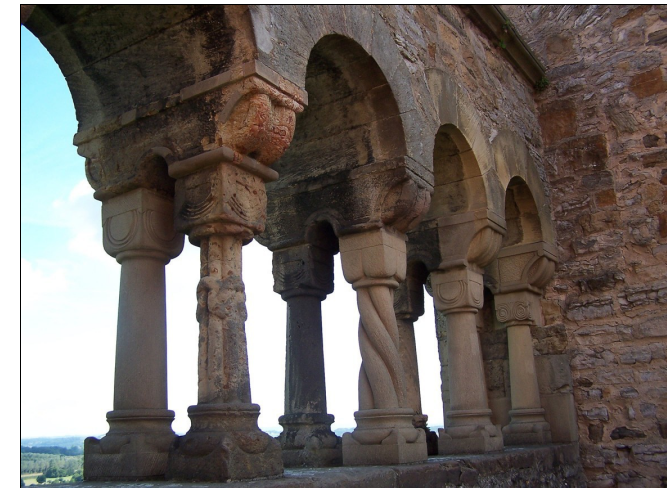
Blick von Südwesten auf die Palas-Arkaden der staufischen Kaiserpfalz Wimpfen