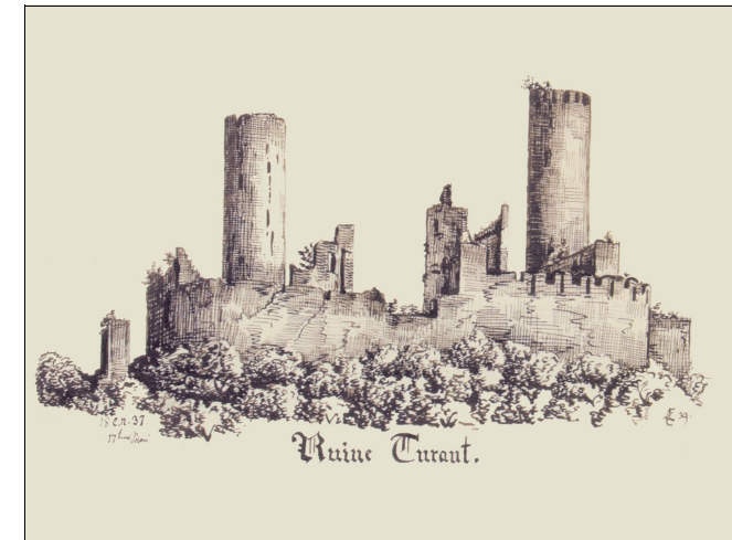
Burgruine Thurant über Alken an der Mosel, Zeichnung von Leopold v. Eltester (Koblenz, * 1822, † 1879) aus dem Jahr 1837.