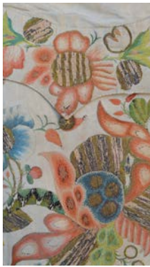
Stickerei Herrenweste um 1740 (Detail)