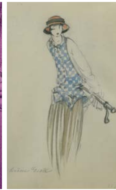
Modezeichnung von Luise Grothe, 1923