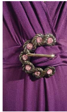
Abendkleid 1930er Jahre (Detail)