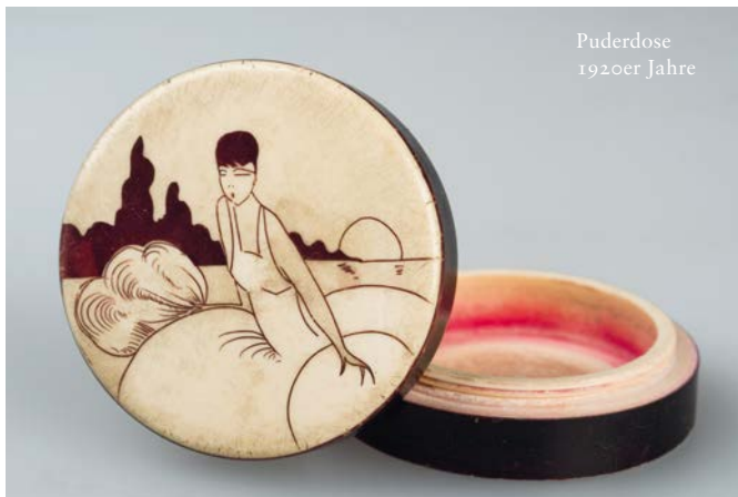
Puderdose 1920er Jahre

Über fünf Jahre waren die Originalkostüme der Textilsammlung Max Berk/Kurpfälzisches Museum nicht zu besichtigen. Nun bietet sich den interessierten Besuchern erneut die Gelegenheit, die Highlights der Sammlung in einem kleinen Streifzug durch die Modegeschichte zu erleben. Der Modereigen spannt sich von den ältesten Exponaten aus dem 18. Jahrhundert über ein Frühbiedermeierkleid und einige Kostüme aus der 2. Hälfte des 19. Jahrhunderts bis zu der verrückten Mode der Charlestonzeit und den typischen Petticoat-Kleidern der 50er Jahre. Neben den Kostümen werden auch zeittypische Accessoires und Modekupfer gezeigt.