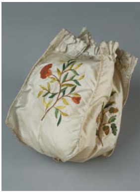
Beutel spätes 18. Jh.