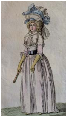
Modekupfer aus Journal des Luxus und der Moden Juli 1789