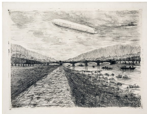
Adolf Hacker, Zeppelin LZ 10 über Heidelberg 1912, Kaltnadelradierung, 198 x 149 mm, KMH, Inv. Nr. S 1100/1