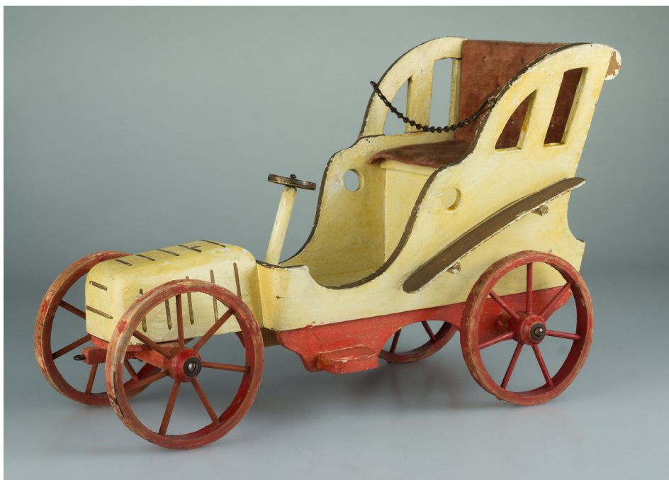
Holzauto Holz, Samt, Leder keine Fabrikatsmarke L. 40 cm, B. 19 cm, H. 25 cm Inv. Nr. Sp 34

Als der erste reinrassige Sportwagen der Welt gilt der Austro Daimler „Prinz Heinrich“ aus dem Jahre 1909. Von diesem damals innovativen Modell könnte der Spielzeugwagen aus dem Kurpfälzischen Museum inspiriert sein. Der Vorbesitzer ist leider nicht bekannt. Der offene Wagen mit großen Speichenrädern ist aus Holz gefertigt, farbig gefasst, der Sitz mit ehemals rotem Samt gepolstert. In der Kühlerhaube befindet sich ein Loch; dort saß vermutlich eine Hupe. Eine Fabrikatsmarke fehlt, so dass es sich wahrscheinlich um ein Unikat handelt, das nicht in Serie hergestellt wurde. Der Wagen ist ein Zeugnis für die allgemeine Mobilisierung und Beschleunigung des Lebens um 1900, die alle Lebensbereiche, auch die der Kinder, umfasste. Das besondere Stück wird in der Ausstellung Mobile Kinderwelten – Was Kinder schon immer bewegt hat vom 24. März bis 30. Juni 2019 im Kurpfälzischen Museum Heidelberg zu sehen sein. Das Ausstellungsprojekt ist eine Kooperation mit dem Deutschen Fahrradmuseum Bad Brückenau und beschäftigt sich mit dem Thema Kinderfahrzeuge aus zwei Jahrhunderten. Viele Exponate in der Ausstellung „Mobile Kinderwelten“ stammen aus der Nachkriegszeit und den 1970er Jahren, doch werden auch Raritäten aus der Anfangszeit der Fahrradgeschichte zu sehen sein.