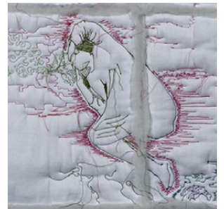
Birgit Reinken schlafaus schlafein