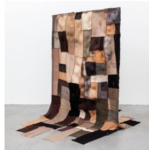
Silke Marohn Zusammenhalt / Cohesion