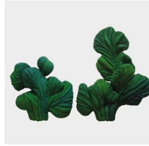
Dana Pelea Botanical